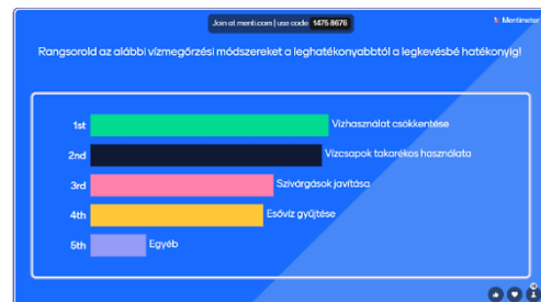
3. ábra Mentiméter felmérés